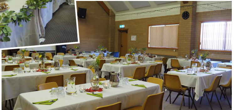
Mother's Day Program, Sabbath May 15